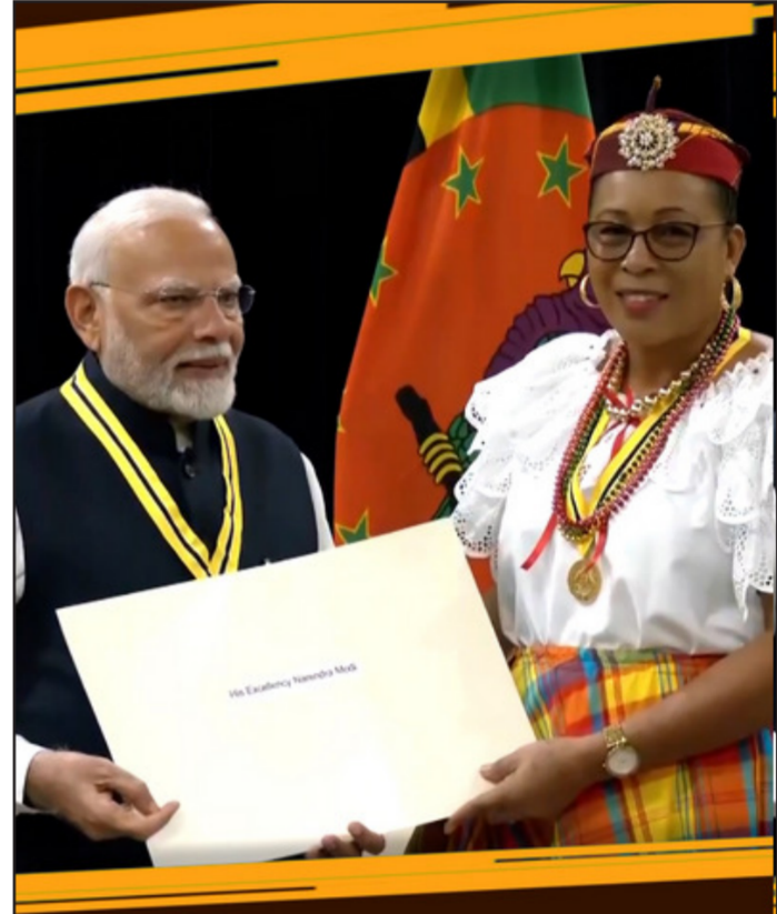
भारत-कैरिबियन शिखर सम्मेलन के मौके पर आयोजित एक कार्यक्रम में

को मजबूत करने की उनकी प्रतिबद्धता के लिए गुयाना के सर्वोच्च राष्ट्रीय पुरस्कार, श्रद्धा अर्द्ध ऑफ एक्सीलेंस से सम्मानित किया। पुरस्कार स्वीकार करते समय प्रधानमंत्री ने इस सम्मान को भारत के लोगों और दोनों देशों के लोगों के बीच गहरे ऐतिहासिक संबंधों को समर्पित किया। उन्होंने इस बात पर जोर दिया कि उनकी राजकीय यात्रा भारत-गुयाना मित्रता को गहरा करने की दिशा में भारत की निरंतर प्रतिबद्धता का प्रमाण है। उल्लेखनीय है कि प्रधानमंत्री श्री मोदी गुयाना के सर्वोच्च राष्ट्रीय सम्मान प्राप्त करने वाले चौथे विदेशी नेता हैं। बाद में दूसरे