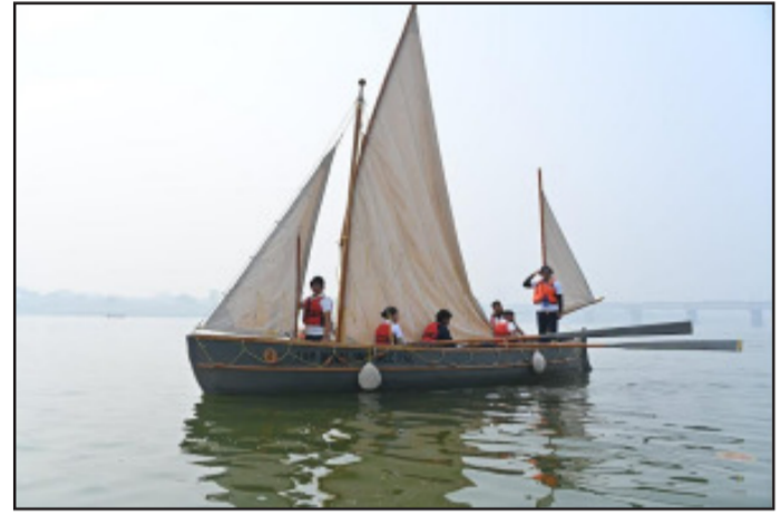
सलामी लेते पंजाब प्रांत कैडेट।