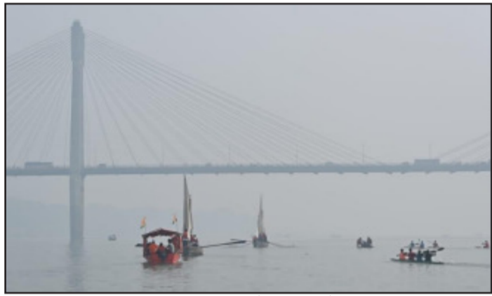
अभियान अपने गंतव्य ओर।