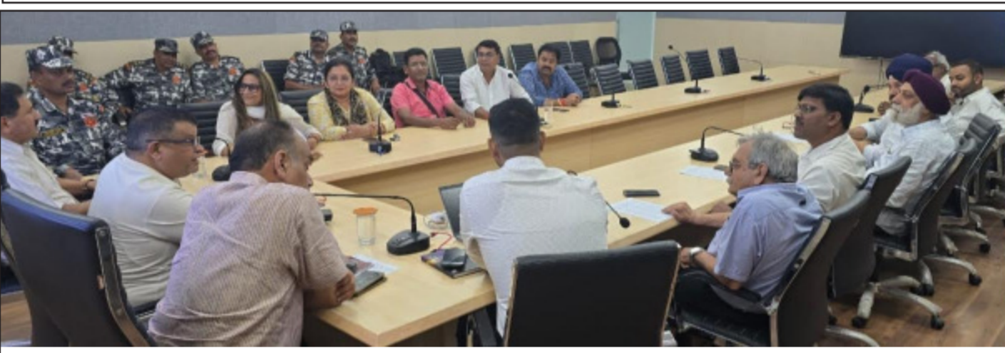
As directed by the DM Prayagraj, a meeting was held today at Nagar Nigam Prayagraj apprising the members of Vyapar Mandal about the joint Police- Nagar Nigam enforcement drive planned in prelude to Mahakumbh-25 on all important roads of the city.