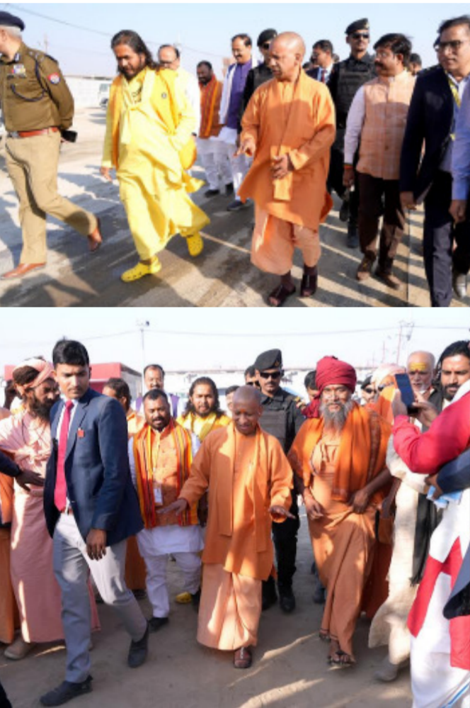
मुख्यमंत्री योगी आदित्यनाथ ने गुरुवार को सेक्टर 20 में स्थापित अखाड़ा सेक्टर का निरीक्षण करते हुए।

प्रयागराज। ग्रामीण जलापूर्ति व नमामि गंगे विभाग की तरफ से महाकुम्भ में रजल मंदिर भी बनाया जाएगा। रजल मंदिर में भगवान शिव की जटा से गंगा धरती पर आएंगी। इसके जरिए संदेश दिया जाएगा कि जल प्रसाद है। जल जीवनदायी है। इसे बर्बाद न करें, बल्कि इसका संरक्षण करें। रजल मंदिर में सुबह-शाम जल आरती भी होगी। इस आरती में जल जीवन मिशन की गाथा, जल संरक्षण का संदेश भी होगा। 51 दिन तक चलनेगी प्रदर्शनी, होंगे अलग-अलग कार्यक्रम। कभी प्यासे रहे बुदेलखंड में योगी सरकार से पेयजल की समस्या का समाधान हो गया है। सफलता की इस कहानी को लेकर श्येजल का समाधान, मेरे गांव की नई पहचान थीम पर प्रदर्शनी लगाई जाएगी। प्रदर्शनी 5 जनवरी से 26 फरवरी तक चलनेगी। 51 दिन तक चलने वाली प्रदर्शनी में अलग-अलग कार्यक्रम भी होंगे। प्रदर्शनी में बुदेलखंड के ग्रामीण महिलाओं को मंच मुहैया कराया जाएगा, जिसमें वे बुदेलखंड में बदलाव की कहानी बयान करेंगी। बांदा, झांसी, चित्रकूट के जिन गांवों में पानी न होने के कारण शादी नहीं हो पाती थी, वहां भी योगी सरकार ने ग्रामीणों को शुद्ध पेयजल पहुंचाया। ललितपुर व महोबा के उन गांवों की महिलाएं, पानी ढोने के कारण जिनके सिर से बाल गायब हो गए थे। वे भी डबल इंजन सरकार के अतुलनीय कार्य को महाकुम्भ में शुद्ध पानी से जीवन में आए बदलाव की कहानी को बयान करेंगी।