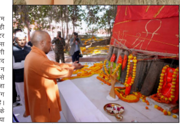
मुख्यमंत्री योगी आदित्यनाथ अक्षय वट का पूजन करते हुए।