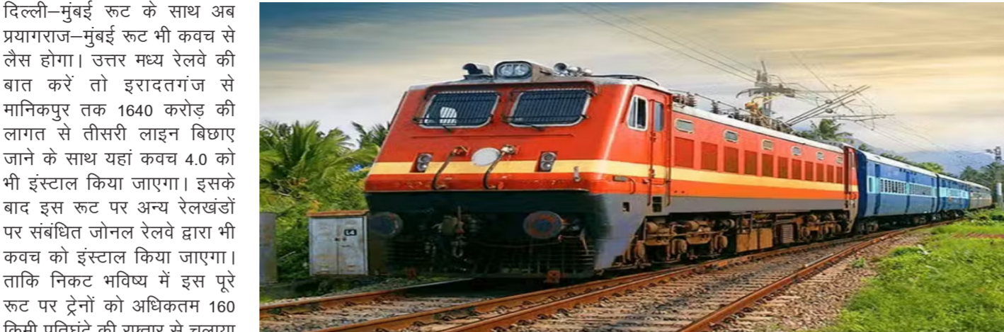
प्रयागराज के सूबेदारगंज में कवच से जुड़े कार्य शुरू किए जाने की द्रेन सुरक्षा प्रणाली यानी कवच को लगा दिया गया है। पूरे जोन में

प्रयागराज। दिल्ली-हावड़ा, इरादतगंज-मुंबई रूट पर कवच तैयारी है। एनसीआर में स्वचलित कुछ जगह लगाया भी जा चुका है।